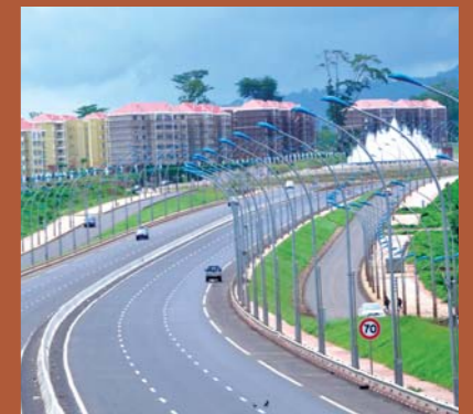
16 km séparent Malabo de Sipopo

Autre infrastructure de désenclavement : l'héliport de Sipopo. Situé entre l'ICC et le Sofitel Le Golf, l'enceinte dispose d'un parking pour hélicoptères pouvant contenir sept appareils. Inaugurée par le président Teodoro Obiang Mbasogo, le 5 juin 2011, l'autoroute