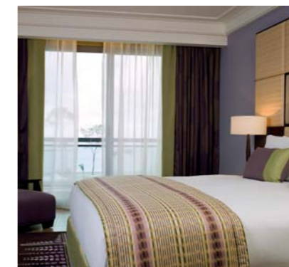
190 chambres tout confort

En matière de détente, Sipopo offre de nombreuses activités sportives : un golf de 18 trous, deux courts de tennis en surface rapide, piscine et sports nautiques, de nombreux parcours pour joggeurs ainsi qu'un paseo marítimo et une promenade sur front de mer, pour les amateurs d'expéditions pédestres. Et pour récupérer de ses efforts physiques ou intellectuels, le visiteur pourra accéder au spa du Sofitel Le Golf, à moins qu'il ne choisisse l'intimité du jacuzzi qui équipe la salle de bains de sa chambre.