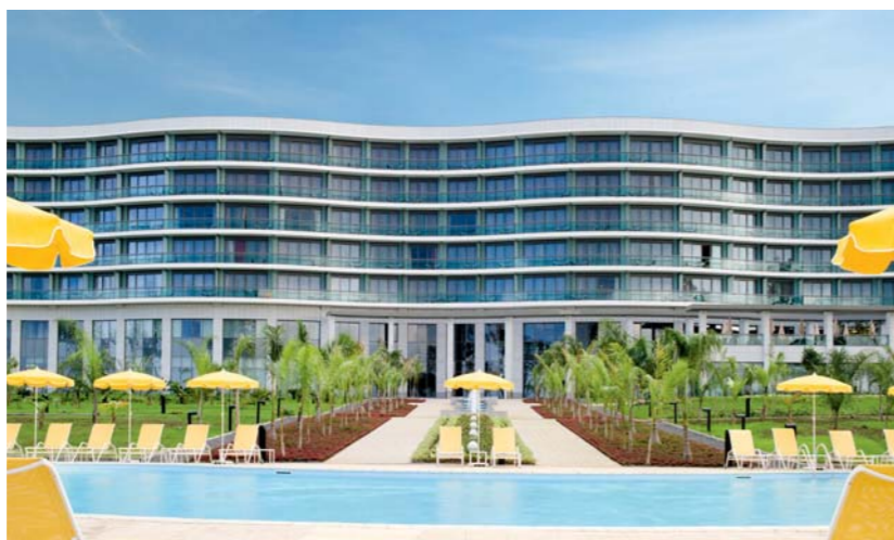
Le cinq étoiles Sofitel Le Golf est installé dans un luxueux immeuble de sept étages.

Sofitel Le Golf, un havre de paix et de confort offrant des prestations haut de gamme et un service irréprochable dans ses trois restaurants, 190 chambres et dix suites toutes équipées des technologies les plus récentes.