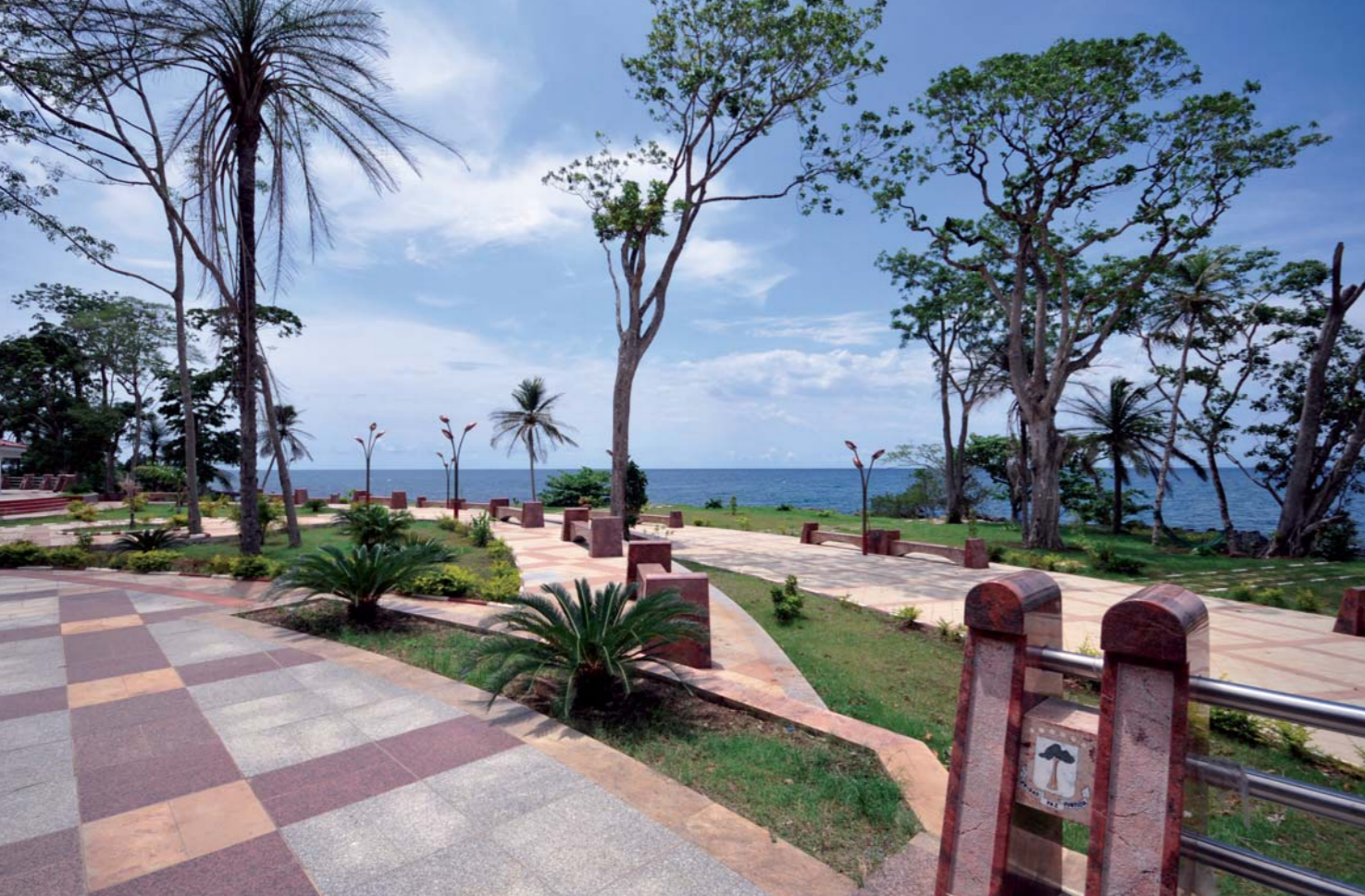
Sur le front de mer, le Paseo marítimo offre ses 4 km aux promeneurs et joggers.