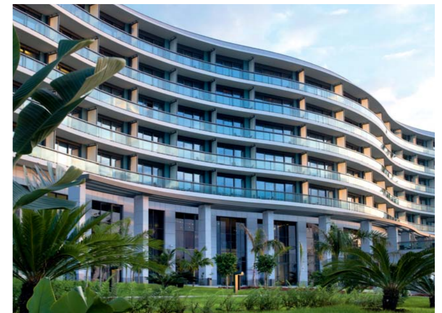
Esthétiques et modernes, toutes les installations répondent aux normes les plus rigoureuses.

beach by a wooden footbridge. For lovers of walking and jogging, a 4-kilometre promenade along the seafront was built by the Egyptian company, Arab Contractors. On the culinary front, Sipopo's designers have left nothing to chance. Three restaurants, one of which is interestingly dome shaped, offer gourmet meals fusing Asian, Brazilian and French cuisine. To nature's perfect palette of ocean blue and forest green, were added the expertise of the builders (French company Bouygues for the hotel and, for the conference centre, China's CSCEC